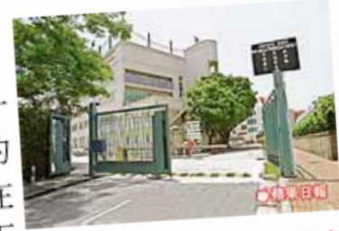
行山猝死男生就讀於英皇佐治五世學校。