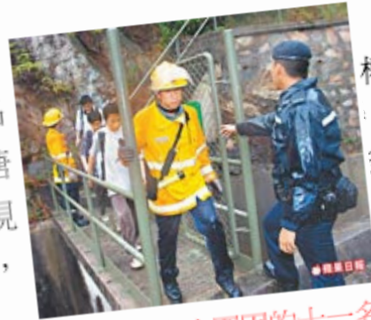
行山遭洪水圍困的十一名師生由消防員救離險境。

【本報訊】天文台昨午發出雷暴警告，本港大部份地區下雷雨，屯門一間中學兩名教師，帶同九名學生行山，行經黃泥墩水塘附近山澗，遇山洪暴發並遭圍困，一度出現險情。消防員到場拯救，將他們救離險境，其中一名學生擦傷手送院。